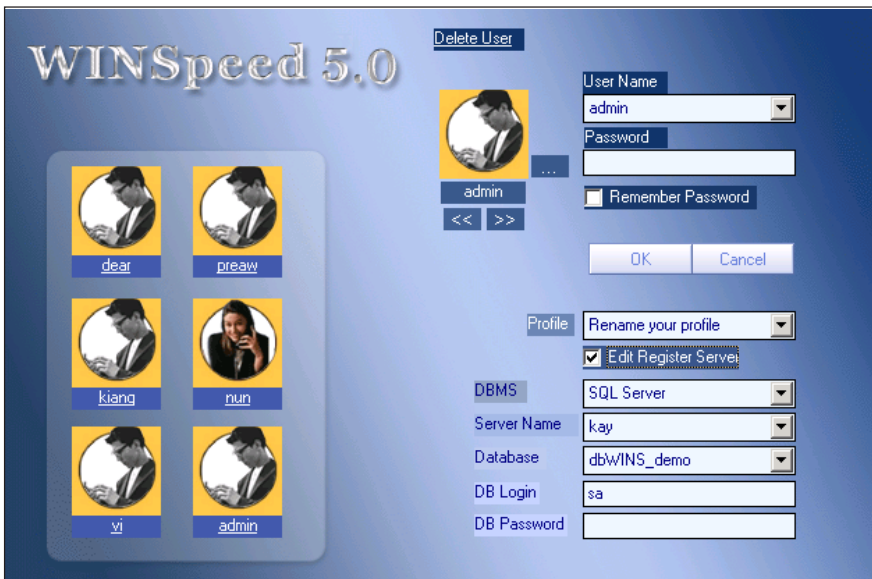
🏠 ตัวอย่างการบันทึก LOG IN